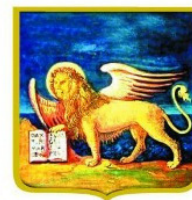
REGIONE DEL VENETO

Il progetto intende favorire lo sviluppo in azienda dell'innovazione digitale attraverso la collaborazione intergenerazionale e il trasferimento di conoscenze tra lavoratori maturi, lavoratori giovani e disoccupati. Si selezionano 4 disoccupati da inserire in formazione e tirocinio per il profilo professionale di Addetto Back Office . I tirocinanti, inseriti in aziende in forte sviluppo, svolgeranno mansioni legate alla gestione documentale (amministrativa e commerciale) dei clienti, allo sviluppo di campagne promozionali anche attraverso canali digitali, alla fidelizzazione dei clienti attuali e potenziali.